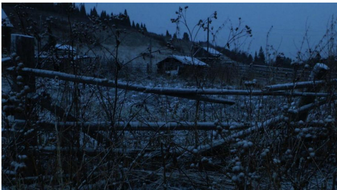
Les forêts sombres

Tourné en Sibérie, le film raconte, par la voix de Denis Lavant, le quotidien d'un hameau de Sibérie du Sud, entre boue, froid, alcool et pauvreté.