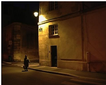
Le monde extérieur

Pendant l'estive des bergers kirghizes dans les Monts Tian Shan, en face de la Chine, les disputes de bergers vivant sous la même tente et la solitude du cinéaste, au milieu d'eux, mais comme perdu dans ses pensées.