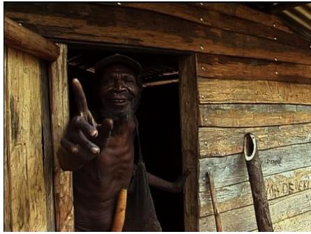
Eux et moi © Stéphane Breton

20h15-22h30 : ÉCHANGES ENTRE STÉPHANE BRETON ET LES SPECTATEURS